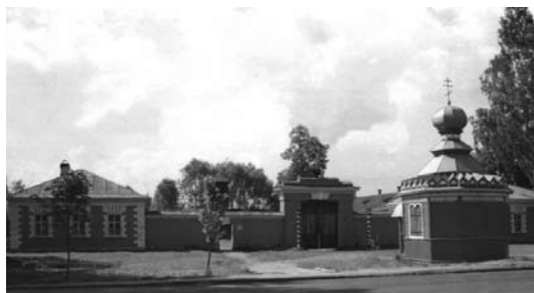
Музей «Дом станционного смотрителя»

Александр Сергеевич Пушкин много путешествовал. Среди дорог, по которым проезжал А.С. Пушкин, особое место занимал Белорусский почтовый тракт, шедший от Петербурга в западные губернии России. Поэт не менее 13 раз проезжал по этому тракту, здесь же пролегал и последний, посмертный путь поэта, в Святогорский монастырь, «к милому пределу».