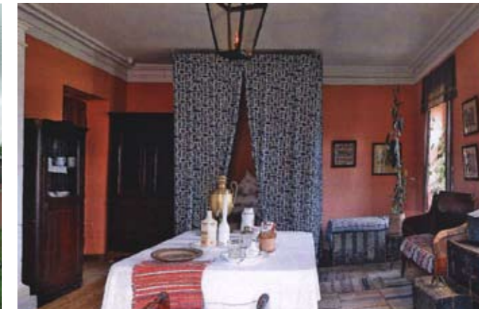
Чистая половина для проезжающих. Современная фотография