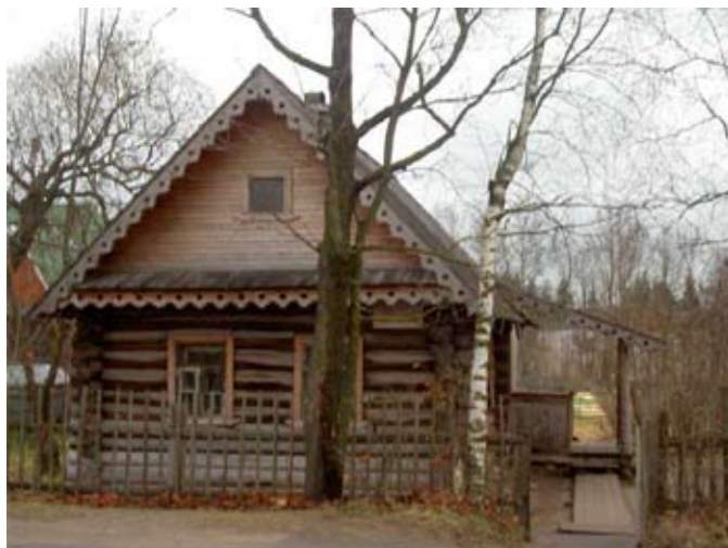
Музей «Домик няни А.С. Пушкина»

«Мы, детскую кагая колыбель, Аой пошый слух напевали пеленка...»