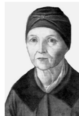
Арина Родионовна (?) С портрета неизвестного художника. 1820-е гг.

С деревней Кобрине тесным образом связана судьба Арины Родионовны. Здесь находится уникальный музей «Домик няни А.С. Пушкина». Документально установлено, что знаменитая няня А.С. Пушкина – Арина Родионовна – жила в этой избушке после замужества, до своего отъезда вместе с семьей Пушкиных в Москву. А потом в этом доме до 1974 года жили ее потомки.