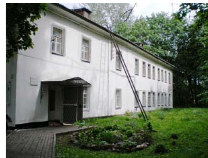
Каменный гостевой флигель