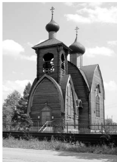
Храм Воскресения Христова. Суйда.