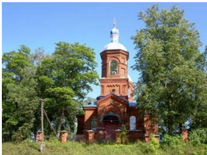
Храм Рождества Пресвятой Богородицы