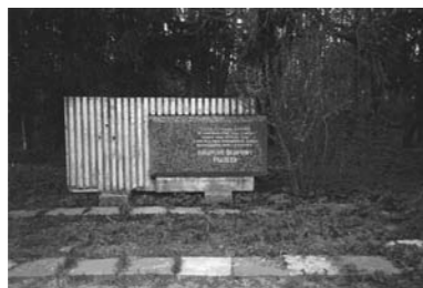
Памятная стела К.Ф. Рылееву.

В Батово на месте господского дома в 1970