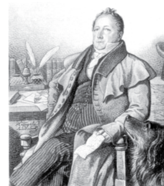
Сергей Львович Пушкин. К.К. Гампельн. 1824 г.