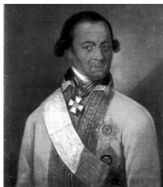
Абрам Петрович Ганнибал. Неизвестный художник. 2-я пол. XVIII в.

В 1759 году у потомков П.М. Апраксина Суйдинскую мызу с окрестными селами и деревнями приобрел прадед А.С. Пушкина по материнской линии Абрам Петрович Ганнибал. Удивительная, полная приключений жизнь Ганнибала всегда интересовала А.С. Пушкина. Поэт часто упоминал о нем в своих автобиографических записях, посвятил ему неоконченный роман «Арап Петра Великого».