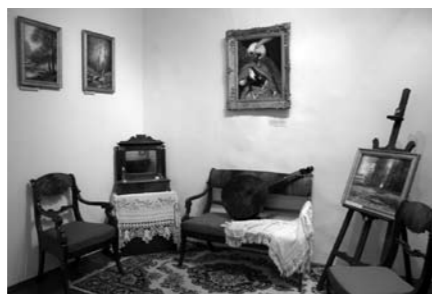
Экспозиция музея-усадьбы «Суйда».

В Суйдинском парке многое уже утрачено. По рассказам старожилов, в конце XIX века в парке были еще грот и беседка, канал, по которому ходили лодки, большая цветочная клумба за усадебным домом и солнечные часы. Солнечные часы находились по традиции недалеко от господского дома, на живописной поляне, в окружении деревьев старого парка. Значительно поврежденные в годы последней вой-