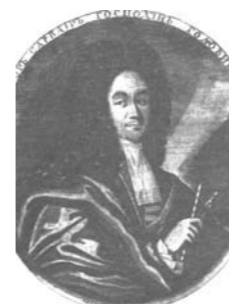
Иван Михайлович Головин

Тайцы впервые упоминаются в Новгородской писцовой книге 1499 года. Здесь, на земле Водской пятины, обозначено село Стаища. Мыза Тайцы вместе с окрестными деревнями в начале XVIII века были пожалованы Петром I адмиралу Ивану Михайловичу Головину.