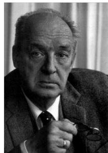
Владимир Владимирович Набоков

Усадьба была благоустроена. Построены террасы с балюстрадами, разбиты цветники, в парке появились новые беседки, павильоны, оранжереи. На деньги Рукавишникова в Рождествено были построены школа, амбулатория, здание народного театра. С 1901 года владельцем имения стано-