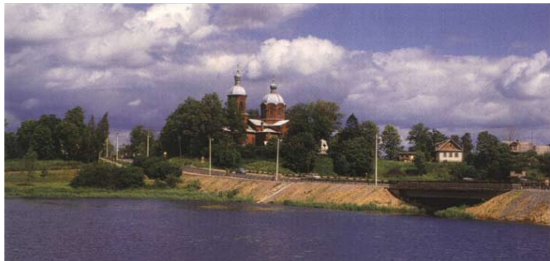
Панорама села Рождествено