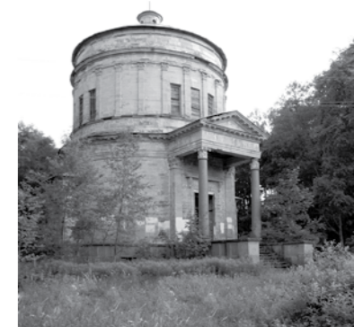
Костел-усыпальница Святой Стефаниды в Дружноселье.