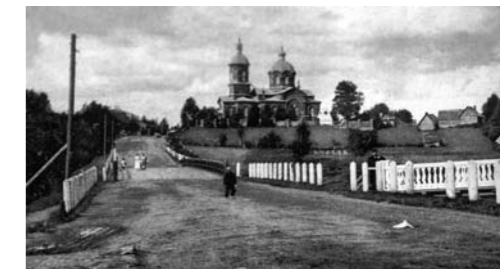
Панорама села Рождествена

Вот на Лугу шоссе. Дом с колоннами. Оредежь. Отовсюду почти мне к себе до сих пор еще удалось бы пройти.