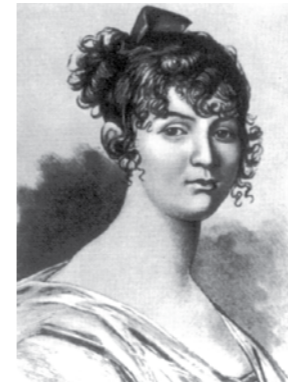
Надежда Осиповна Пушкина. Миниатюра Ксавье де Местра. 1810 г.

В Кобрино и на Руновской мызе в летние месяцы вместе Марией Алексеевной жила и ее дочь – Надежда Осиповна, будущая мать А.С. Пушкина.