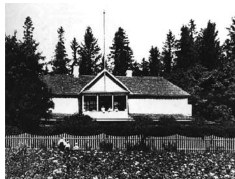
Дачная усадьба «Елицы». Фотография В.М. Нарбута. 1909 г.

имение петербургским дачникам. От старых Елиц ничего не осталось, усадебный дом сгорел в 1937 году, исчезли и все прочие постройки.