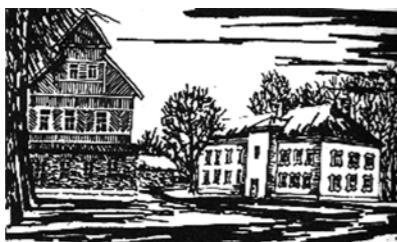
Суйда. Имение А.П. Ганнибала. Рис. С.П. Светлицкого. 1970 г.

Там запах ландышей весь воздух наполнял, Там пели соловьи, там ручеек журчал.