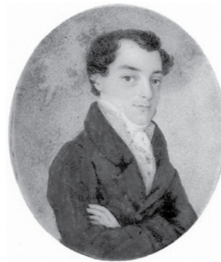
Кондратий Федорович Рылеев.

Еще в 1930-х гг. местные старожилы показывали у въезда в имение камень, на котором, якобы, сидели Пушкин и Рылеев, «любующься ледоходом на реке Оредеж», и в те годы на седом валуне будто бы можно было рассмотреть выбитую надпись «Пушкин». Пушкин познакомился с К.Ф. Рылеевым незадолго до высылки из Петербурга.