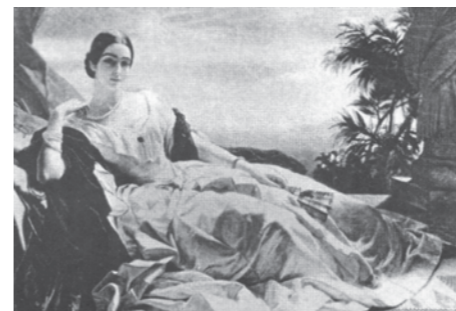
Стефания Витгенштейн, урожд. княжна Радзивилл.

... Она готова хоть в пустыню Бежать со мной, презрев молву. Хотите знать мою богиню, Мою Варшавскую графиню?.. Нет! ни за что не назову!