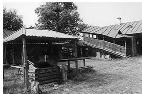
Во дворе музея

не сохранилась. Существующий ныне почтовый комплекс был возведен по типовому проекту в 1839–1841 годах.