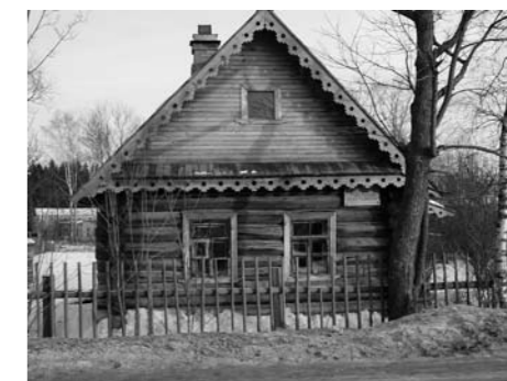
Музей «Домик няни А.С. Пушкина» в деревне Кобрине.

В «Домике няни» воспроизведено убранство крестьянской избы конца XVIII – начала XIX века. При входе – русская печь, рядом, за холщовой занавеской, – кровать, здесь подвесная детская люлька, простой стол с посудой из дерева, глины и бересты. Широкие лавки, сундуки и другие предметы домашней крестьянской утвари. В углу иконы и лампадка. Почти все экспонаты в музее – это дары жителей Кобрина.