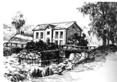
Ганнибаловская мельница на реке Суйда. Рис. А. Васильева. 1953 год.

ны, солнечные часы были утрачены в середине 70-х годов.