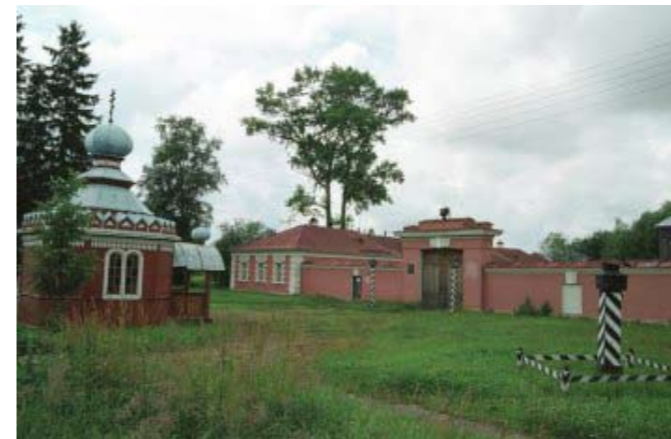
Музей «Дом станционного смотрителя»

«Но в коляске, то верхом, Но в кибитке, то в карете...»