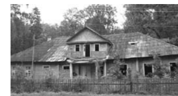
Усадебный дом. Фасад со стороны подъездной аллеи.

Исключительно важным событием для формирования мировоззрения Пушкина стала Отечественная война 1812 года. Все события происходили на глазах воспитанников Лицея. Они живо обсуждали каждую неудачу и всякий успех России в войне. С уст лицеистов не сходили славные имена Витгенштейна, Багратиона, Кутузова, Давыдова, Платова и других героев. По дороге на Сиверскую расположена старинная усадьба «Дружноселье», связанная с именем знаменитого полководца, героя Отечественной войны 1812 года, князя Петра Христиановича Витгенштейна.