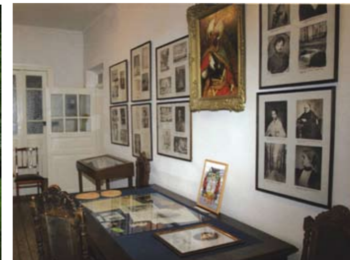
Экспозиция в музее-усадьбе «Суйда»