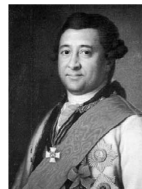
Иван Абрамович Ганнибал. Неизвестный художник.

После смерти Ганнибала усадьба перешла к его старшему сыну – известному деятелю екатерининской эпохи, герою многих военных баталий Турецкой войны, генерал-поручику Ивану Абрамовичу Ганнибалу, который приходится Пушкину двоюродным дедом.