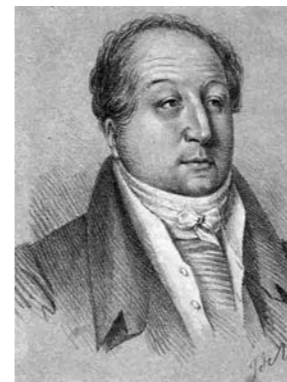
Василий Львович Пушкин.

Сыграл Василий Львович знаменательную роль и в определении Александра Пушкина в Царскосельский Лицей.