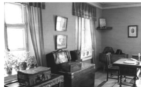
В красном углу смотрителя