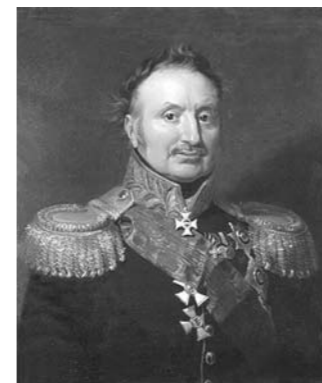
Граф Пётр Христианович Витгенштейн. 1819-1823 гг. Джордж Доу.

Наш Витгенштейн, вождь-герой, Петрополя спаситель. Хвала! Он щит стране родной, Он хищных истребитель.