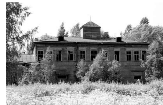
Руновская мыза. Бывший дом Ганнибалов-Пушкиных. Современная фотография.

Сельцо Коприно упоминалось в Окладной книге Водской пятины Великого Новгорода за 1499 год и входило в состав Суйдинского погоста. В 1640 году был основан финский лютеранский приход Коргина, центром которого стало Кобрино. Здесь в 1786 году располагалась деревянная лютеранская церковь Святой Екатерины, до нашего времени не сохранившаяся, и старое финское кладбище.